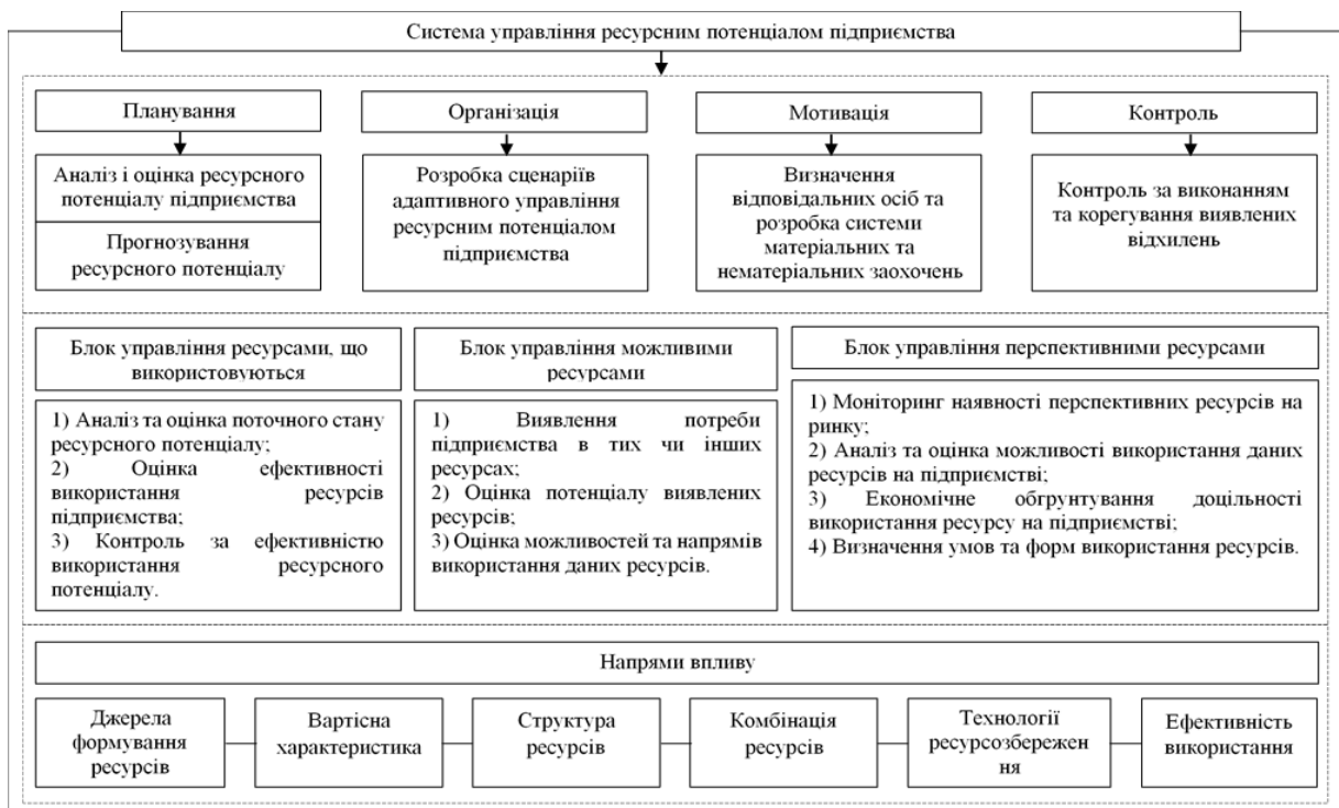
Рис. 2. Модель управління ресурсним потенціалом підприємства (розроблено авторами на основі [29, 30, 31])

Управління ресурсним потенціалом підприємства – це складний процес, який передбачає сукупність впорядкованих дій (рис. 2).