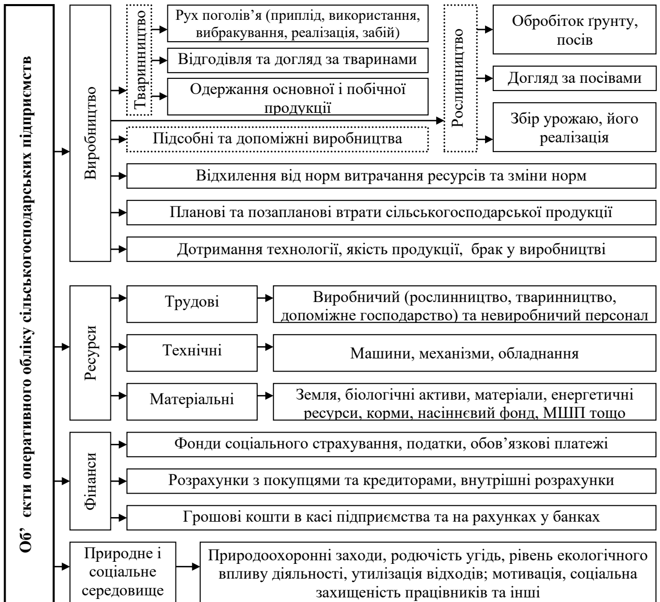
Рис. 1. Об'єкти оперативного обліку в системі управління сільськогосподарським підприємством

опитування, спостереження, розрахунків тощо. Одним із завдань удосконалення системи оперативного обліку визначено максимальне скорочення часу управлінців на одержання інформації.