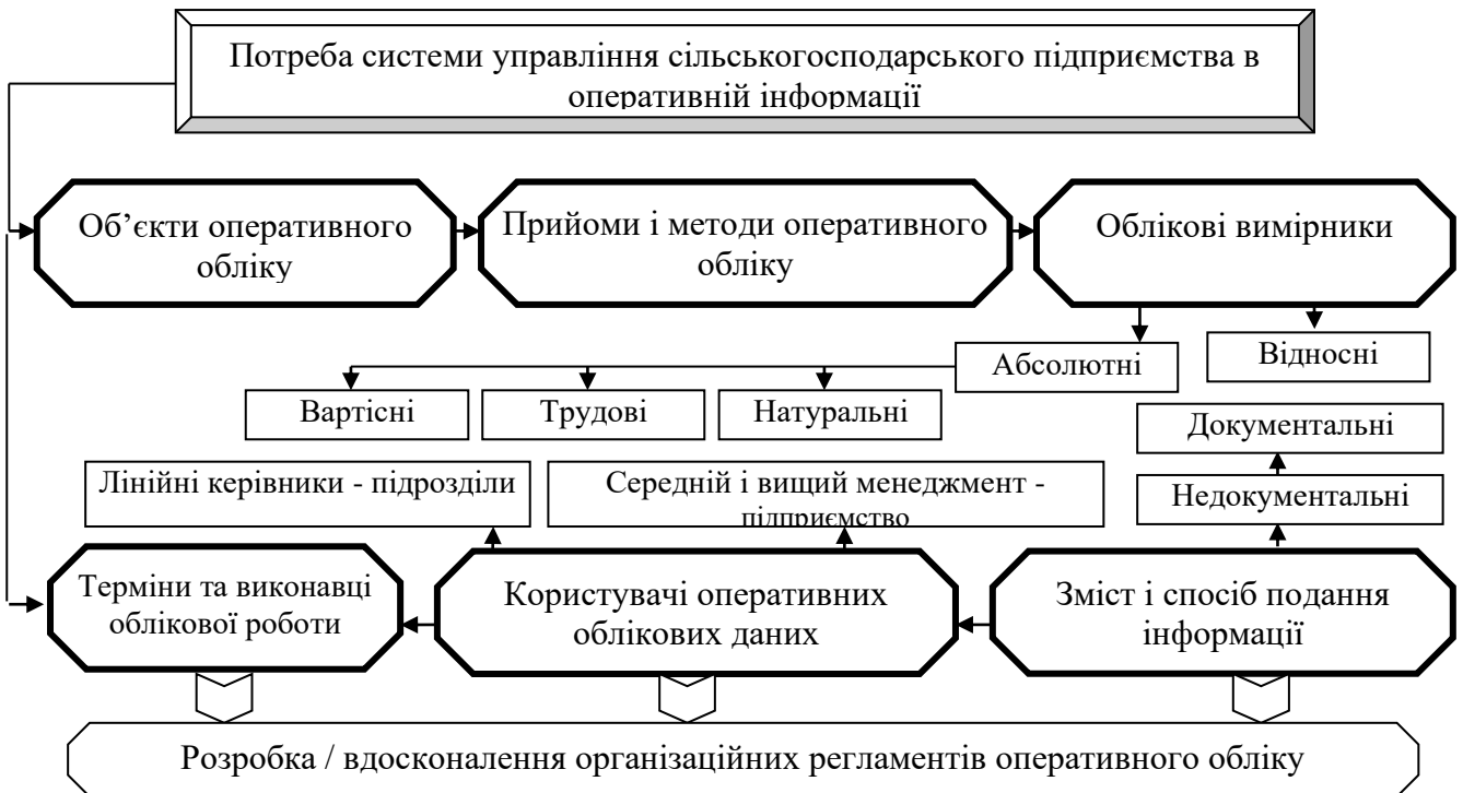
Рис. 3. Напрямки вдосконалення оперативного обліку в управлінні сільськогосподарським підприємством

обліку. В носіях оперативної інформації враховано відповідні способи групування даних, адже пізніше такі показники узагальнюються й аналізуються.