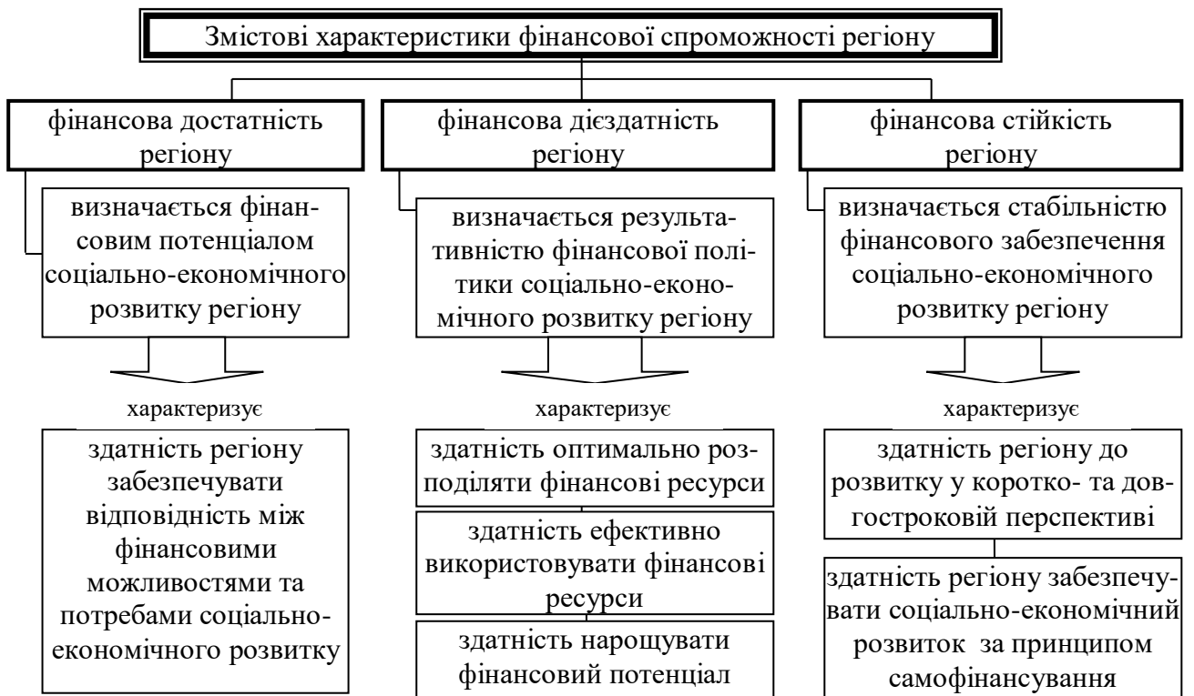
Рис. 1. Змістові характеристики фінансової спроможності соціально-економічного розвитку регіону

У дисертації проведено теоретичний аналіз сутності фінансової спроможності соціально-економічного розвитку регіону, що дозволило виділити три підходи до визначення її змісту, за якими вона розглядається як достатність фінансового потенціалу, результативність використання фінансових ресурсів і як фінансова можливість самостійно забезпечувати соціально-економічний розвиток. Результати дослідження стали передумовою формування концептуальних засад фінансової спроможності соціально-економічного розвитку регіону, в основу яких закладено її змістові характеристики: фінансову достатність, фінансову дієздатність та фінансову стійкість регіону (рис. 1).