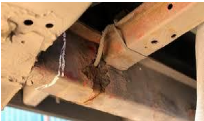
Рис. 1 – Поява тріщини у балці лонжерона автомобіля

Балки і пластини є важливими несучими елементами більшості конструкцій механізмів та машин, що працюють на згин або кручення. Надзвичайно важливою є безпечна робота несучих балок лонжеронів автомобілів (рис. 1), що працюють в умовах повторно-змінних навантажень і мають велику кількість концентраторів напружень. Напруження викликають у балках появу тріщин, що можуть спричинити небезпечні аварії. Розрахунок цих елементів є надзвичайно складним і вимагає урахування великої кількості різних факторів.