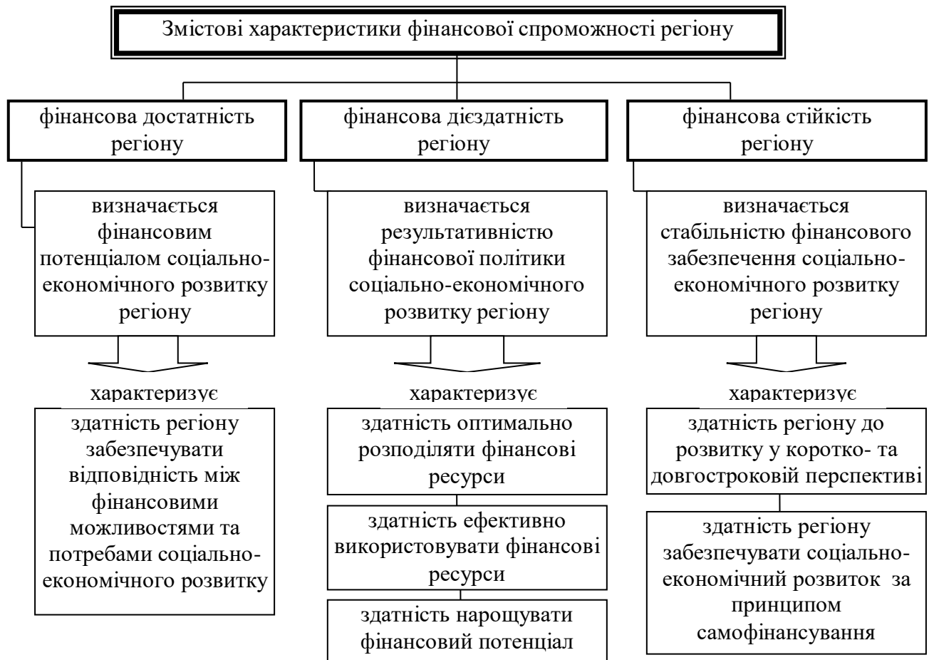
Рис. 1. Змістові характеристики фінансової спроможності соціально-економічного розвитку регіону*