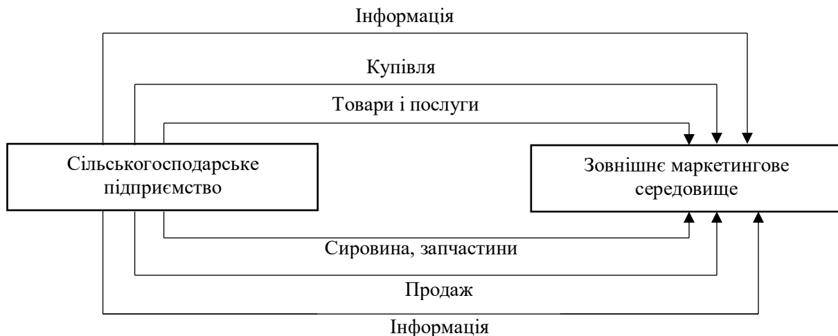
Рис. 2. Система взаємодії сільськогосподарського підприємства із зовнішнім середовищем [8]

Сільськогосподарське підприємство не здатне самотійно себе забезпечувати, тому між ним і навколишнім маркетинговим середовищем відбувається постійний обмін ресурсами та інформацією. Щоб продовжити своє функціонування, сільськогосподарське підприємство змушене, з одного боку, пристосовуватися до змін у зовнішньому маркетинговому середовищі, а з іншого - впливати на неї в силу своїх можливостей. Система агромаркетингу включає в себе комплекс найбільш істотних ринкових відносин і інформаційних потоків, які зв'язують сільськогосподарське підприємство з ринками збуту її товарів (рис. 2).