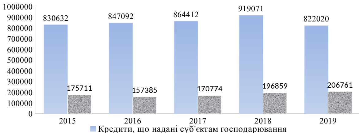
Рис. 2. Динаміка обсягу кредитів, наданих банками основним групам позичальників, %.

З метою оцінки динаміки обсягів кредитів, наданих банками, представимо графічно обсяги кредитів, наданих суб'єктам господарювання кредитів та кредитів, наданих фізичним особам (рис. 2).