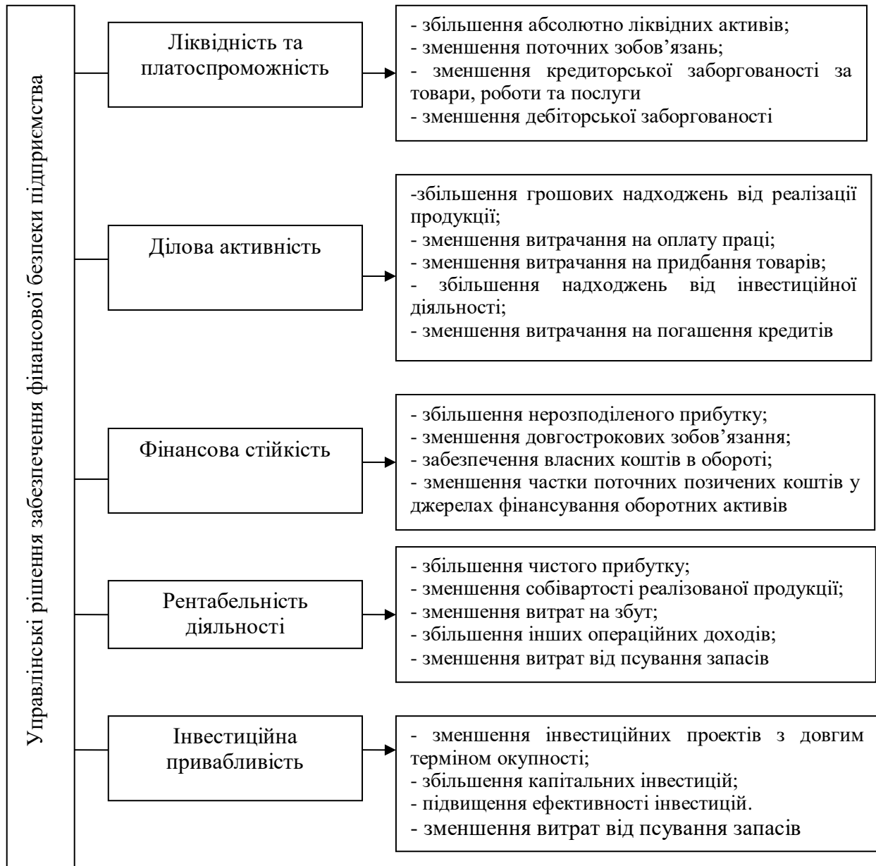
Рис. 3. Напрями управління фінансовою безпекою фермерських господарств*

фінансової безпеки фермерських господарств необхідно, здійснювати ефективну управлінську діяльність за такими напрямками: ліквідність і платоспроможність, ділова активність, рентабельність, фінансова стійкість та інвестиційна привабливість. На рисунку 3 відображено напрями управління фінансовою безпекою фермерських господарств.