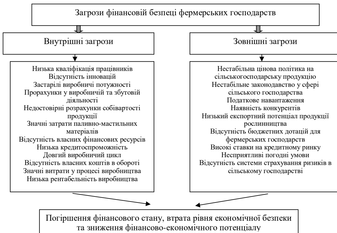
Рис. 1. Загрози фінансовій безпеці фермерських господарств*

Зважаючи на вище зазначене, можна свідчити про наявність різноманітних підходів до виокремлення факторів та загроз зміни рівня фінансової безпеки підприємств. Адаптуючи дані вивчення до діяльності сільськогосподарських підприємств, можна подати власну класифікацію загроз рівню фінансової безпеки фермерських господарств. У процесі формування комплексу загроз втрати фінансової безпеки фермерських господарств, варто дослідити усі зовнішні фактори, притаманні лише для даних суб'єктів господарювання. У цьому аспекті необхідно звернути увагу на природно-кліматичні умови, законодавчі обмеження, експортний потенціал галузі, цінову політику та наявність конкурентів. На рисунку 1 відображено загрози зниження рівня фінансової безпеки фермерських господарств, які окрім цього можна вважати факторами впливу на її зміну.