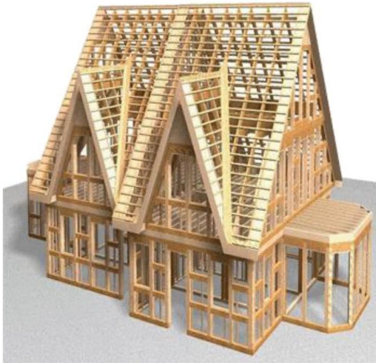
Рис. 2. Дерев'яний каркас швидкозведеного каркасно-панельного будинку

Переваги листового складання полягають у невисокій ціні, а недоліки — в трудомісткості процесу.