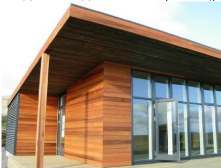
Рис. 4. Загальний вид каркаснопанельного будинку

Висновки. Порівняно з традиційними капітальними, швидкозведені каркасно-панельні будівлі мають безліч переваг. Перш за все, це здешевлення будівництва за рахунок скорочення транспортних витрат, термінів будівництва, економії на будівельній техніці та фундаменті (на відміну від стандартних, швидкозведені конструкції не вимагають глибокого фундаменту або застосування спеціальних будівельних матеріалів). Значна економія на опаленні за рахунок теплосберігальних характеристик, а також швидкозведені каркасно-панельні будівлі мають привабливий зовнішній вигляд і не вимагають додаткової обробки. Це гарантує швидку віддачу від вкладених коштів. Також швидкозведені каркасно-панельні будівлі вирізняє простота і висока швидкість монтажу, легкість підгонки під кліматичні умови (рис. 4, 5).