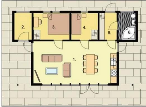
Рис. 5. Схематичний план каркасно-панельного будинку: Експлікація приміщень: 1 - хол з міні-кухнею 32,3 м 2 ; 2 - котельня 4,3 м 2 ; 3 - кабінет 8,9 м 2 ; 4 - кабінет 6,6 м 2 ; 5 - коридор 4,3 м 2 ; 6 - ванна кімната 4,3 м 2 . Загальна площа будинку: 60,7 м 2

високою міцністю, стійкістю і високими акустичними і теплоізоляційними характеристиками;