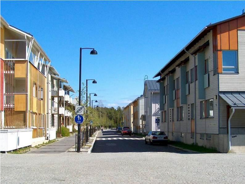
Рис. 1. Квартал дерев'яних будинків каркасно-панельної конструкції. Фінляндія

У нашій країні технологія дерев'яного каркасно-панельного будівництва може широко застосовуватися для будівництва доступного житла в містах і сільській місцевості, для оперативного зведення зручних і недорогих будинків для переселенців, у місцях катастроф, зведення вахтових селищ, військових казарм тощо. Використовуючи універсальні конструкції, можна будувати комерційні та промислові об'єкти: готелі, магазини, ресторани, офіси, склади, ангари і т. п.