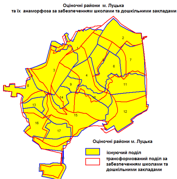
Рис. 2. Анаморфована карта забезпеченості школами та дошкільними закладами районів м. Луцька