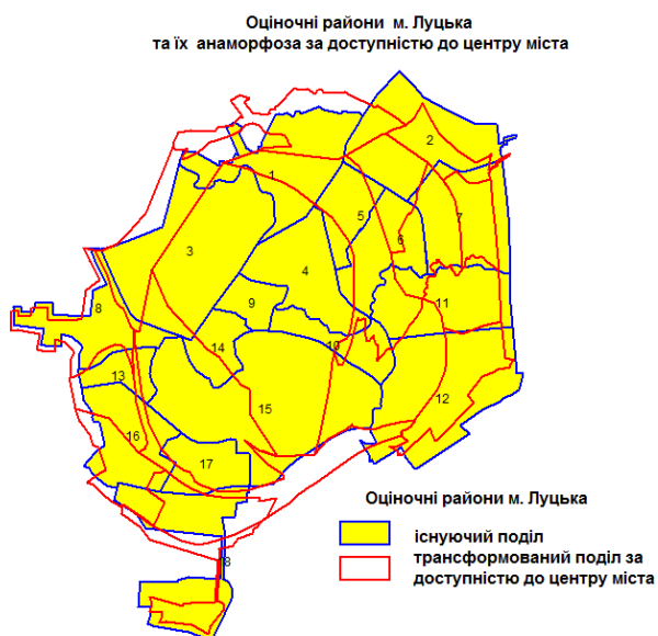
Рис. 1. Анаморфована карта доступності до центру м. Луцька