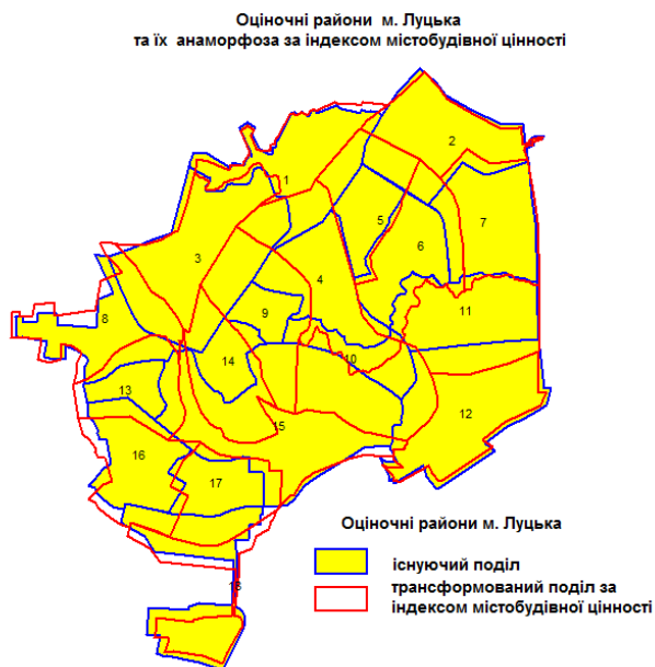
Рис. 3. Анаморфована карта містобудівної цінності оціночних районів міста Луцька