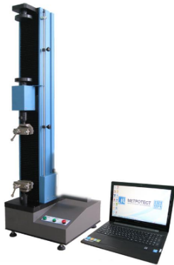
Fig. 3. Bursting test electromechanical machine type REM-M.