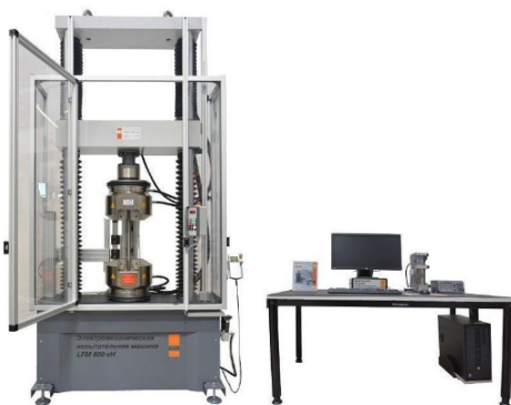
Fig. 4. Test machine LFM-600

The sample testing process is controlled by a computer with the appropriate software. These machines include automatic operation, programming of test parameters, determination of current and maximum values