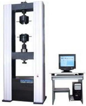
Fig. 1. Electromechanical test bursting machine WDW-200E

This test equipment allows you to examine a variety of materials, including heavy-duty, on compression, stretching, bending and other types of loads according to current world standards (ISO, ASTM, DIN, EN, DSTU, GOST) for industries such as construction, shipbuilding and mechanical engineering, metallurgy, mining and furniture industries and many others.