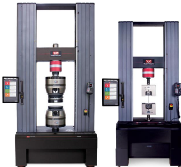
Fig. 2. Universal testing machines INSTRON series 5980

This test equipment allows you to examine a variety of materials, including heavy-duty, on compression, stretching, bending and other types of loads according to current world standards (ISO, ASTM, DIN, EN, DSTU, GOST) for industries such as construction, shipbuilding and mechanical engineering, metallurgy, mining and furniture industries and many others.