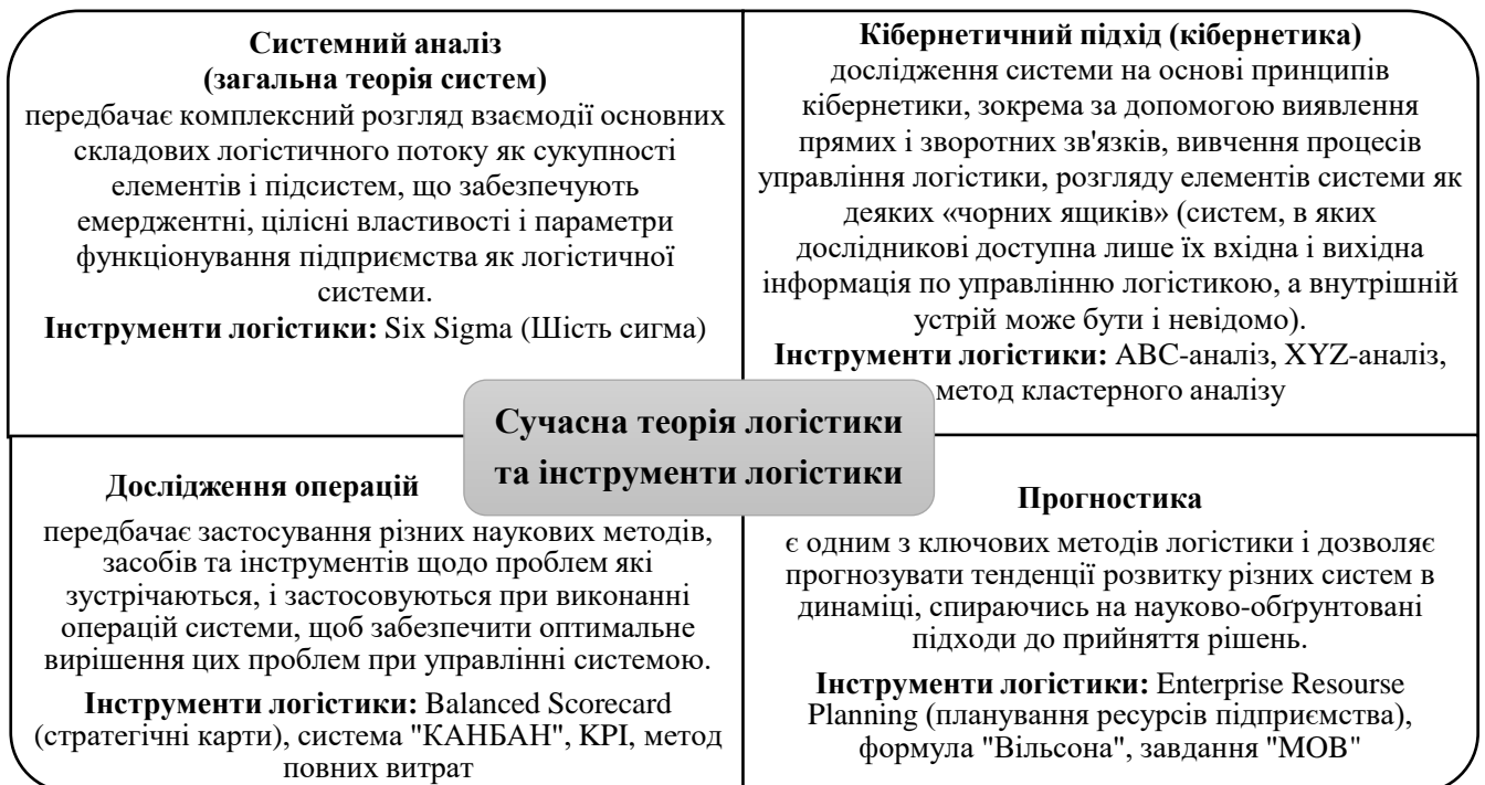
Рис. 1. Зв'язки сучасної теорії логістики та її інструментів в методологіях управління*

Доведено, що реалізація вдалої та ефективної управлінської діяльності на сільськогосподарському підприємстві забезпечується за рахунок формування та використання відповідної методології та інструментарію, який повинен відповідати вимогам сучасного менеджменту (рис. 1).