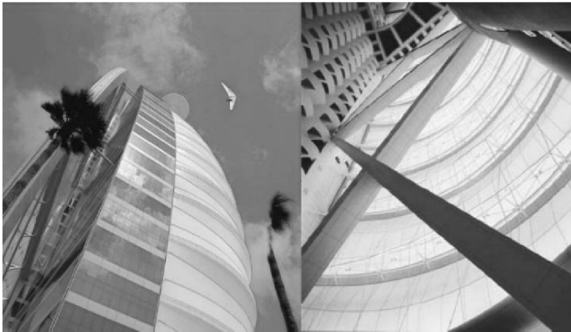
Рис. 2. Готель Burj Al Arab, Дубай, ОАЕ

Використання різних видів тентових покриттів (стаціонарних, тимчасових, таких, що трансформуються) зумовлене архітектурними потребами. Щороку у світі ними перекривається площа, рівна невеликій державі.