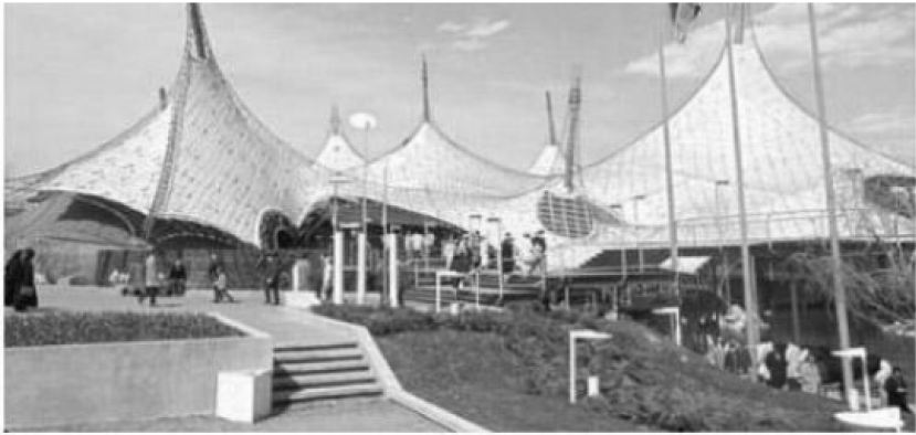
Рис. 1. Тентові покриття подібні до поверхонь мушель і моллюсків

тривалої експлуатації (рис. 2). Це дозволяє розширити можливості їх використання у сучасних архітектурних ансамблях.