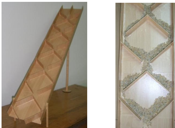
Рис. 2 – Лабораторна установка для дослідження процесу змішування сипких матеріалів

Результати дослідження. Для дослідження змішування двох сипких матеріалів у пропорції 1:1 розроблено лабораторну установку, що представлена на рис. 2. Лабораторна установка містить робочу поверхню (розгортку спірального матеріалопроводу), на якій за принципом “один через один” розташовані об’єднувачі потоків сипких матеріалів і розділювачі потоку матеріалів. Установка виконана з можливістю зміни кута нахилу робочої поверхні до горизонту. На початку робочої поверхні передбачена перегородка, яка розділяє простір між бортами робочої поверхні на дві секції, у кожен з яких завантажуються компонент суміші. Установка дозволяє відтворити процес змішування сипких матеріалів у спіральному змішувачі.