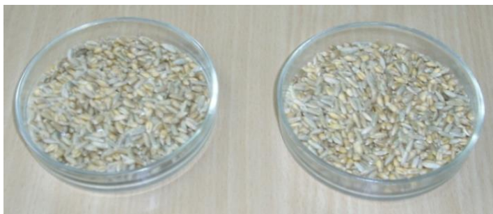
Рис. 3 – Суміш компонентів у лівій та правій ємкостях

Розраховані значення коефіцієнтів неоднорідності суміші з кожної ємкості становлять (приймавши, що основним компонентом в суміші є пшениця): для лівої ємкості – V_C = 9,6\% ; для правої ємкості – V_C = 6,5\% .