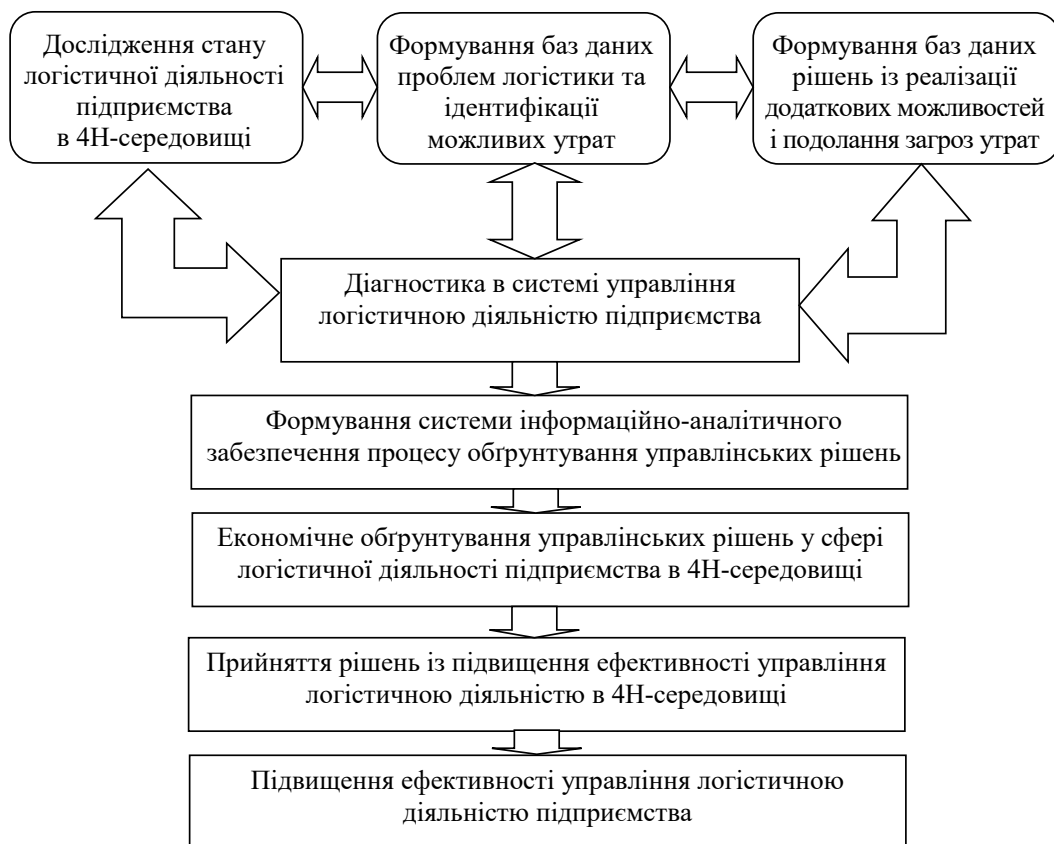
Рис. 1. Роль діагностики в процесі обґрунтування рішень у системі управління логістичною діяльністю підприємства

Діагностика повинна займати центральне місце в системі управління логістичною діяльністю підприємства. Із позицій управління діагностику слід розглядати у тісному взаємозв'язку з процесами планування, організації та контролю, що разом забезпечують оптимізацію матеріальних, фінансових і інформаційних потоків