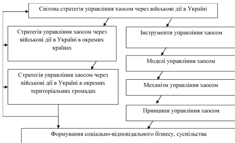
Рис. 3. Стратегія управління хаосом через війну в Україні

Загальна стратегія має бути запропоновано до розробки для країн ЄС та США. Основним блоком у стратегії має стати енергетична безпека. Для цього варто розробити збалансований перехід до альтернативних джерел відновної енергії, яка повністю буде відмова від російського газу та енергоносіїв. Варто налагодити співпрацю із провідними закладами в Європі щодо впровадження альтернативних джерел енергії в Україні. Розвиток концепції енергозберігаючих технологій, розробка стратегії популяризації електротранспорту є важливою для України.