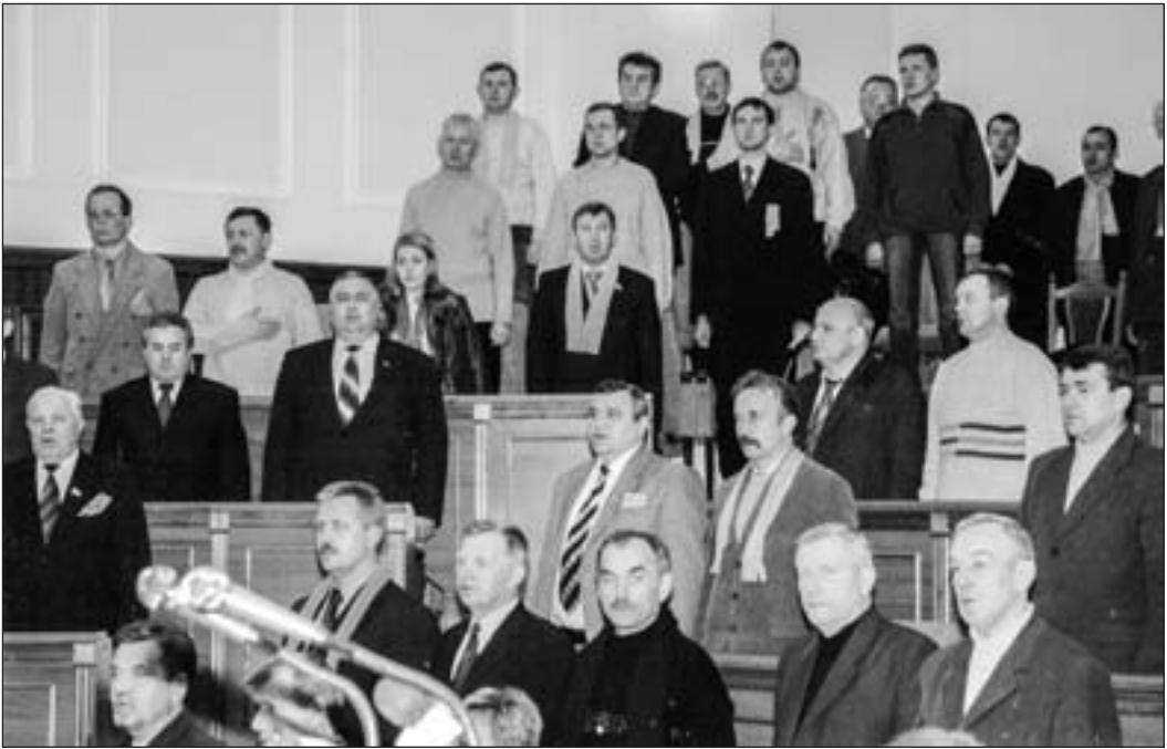
Початок історичної сесії обласної ради 25-26.11. 2004 р.