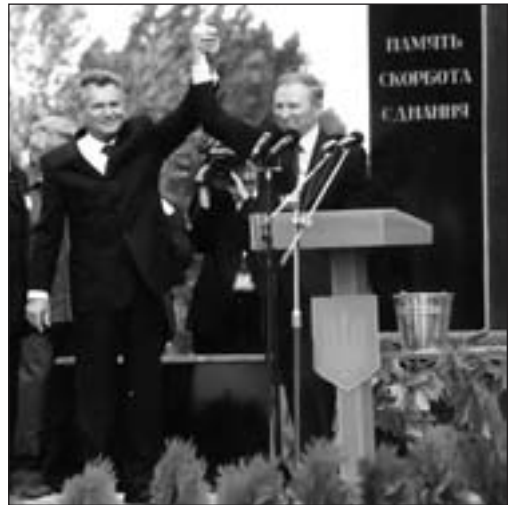
Відкриття пам'ятника у Павлівці президентами України Л. Кучмою та Польщі А. Квасневським

Глава Адміністрації Президента України В. Медведчук скоординував план заходу так, що одні українці, зведені головами райдержадміністрацій з усієї області, біля меморіалу демонстрували відданість українсько-польській дружбі, а інші, яких не було допущено на цей захід (включаючи народних депутатів України), у цей час біля православного храму проводили мітинг протесту. На ньому виступили депутати Верховної Ради України В. Червоній, Б. Загрева, В. Бондар, С. Слабенко та інші промовці. У своїх виступах вони засудили однобоку оцінку подій 60-річної давності, що безапеляційно лунала з уст поляків, та вимагали, щоб Польща покалася за свої зlodіяння перед мирним українським населенням.