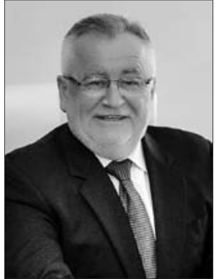
Голова облдержадміністрації Б. Клімчук

26 березня Указом Президента України Борис Клімчук був призначений головою Волинської облдержадміністрації. В одному з інтерв'ю щодо свого повернення на посаду, Борис Петрович зазначив: «Я вже неодноразово розповідав, що не маю жодного стосунку до кадрового рішення. Було кілька зустрічей у Києві, ініційованих людьми, наближеними до Президента. Серед усіх претендентів, в тому числі й тих, яких справді любівали і депутати і столичні політики, шальки терезів переважили на мій бік». 280 «Головне моє завдання – зробити життя волинян ліпшим, заможнішим. Задля цього я повернувся у владу. Задля цього я повернувся додому, на Рідну Волинь. Обов'язок служити людям вважаю найвищим і найпочеснішим у житті». 281 «Насамперед досвід адміністратора дозволяє мені менше вагатися на етапі прийняття рішень. Вони приймаються швидко, оперативно. Сьогодні я менше “промахуюся”, менше “пострілів” повз “десятку”. Все більше потрапляє “у яблучко”. Я вмю їх приймати на рівні досвіду, інтуїції, знань, усвідомлення того, чого, можливо, в попередній каденції я не розумів. Усе-таки шість років дипломатії та понад півтора року праці радником Президента України не могли не додати того, чого, як кажуть, за плечима не носити, – знань і досвіду». 282