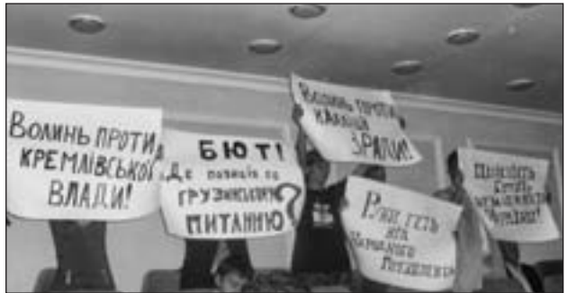
Протестуючі під час сесії облради