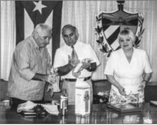
Перебування делегації Волинської області на Кубі

У цей період область налагоджує ділові стосунки з іноземними партнерами. 19 лютого 2001 р. делегація Волинської області на чолі з головою обласної ради