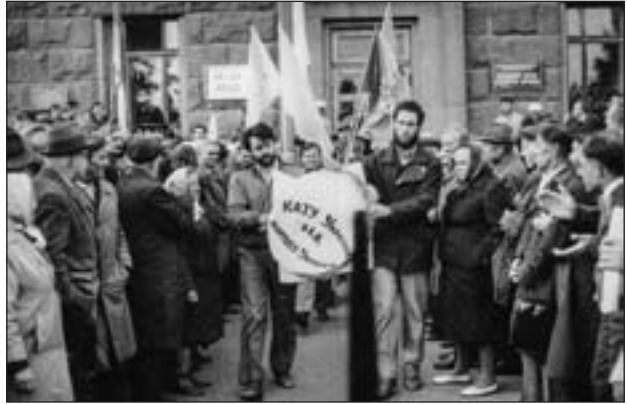
«Покладання» вінка з колючого дроту

У вересні суспільно-політична ситуація у м. Луцьку загострилася. Після того, як 19 липня друга сесія Луцької міської Ради народних депутатів прийняла рішення № 2/14 «Про приміщення міської Ради народних депутатів», у якому запропонувала обкому Компартії України врегулювати з узгоджувальною комісією міської Ради питання про передачу на взаємній згоді приміщення обкому міській Раді до 15 вересня, 44 з 13 вересня представниками національно-демократичних сил розпочалося двотижневе пікетування приміщення обкому Компартії. Поклало початок цій акції «покладання» вінка з колючого дроту з написом «Кату Украї-