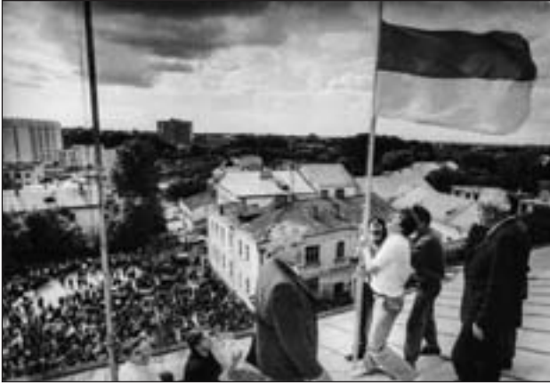
Підняття прапора над приміщенням міськради

Своїм рішенням від 12.07.1990 р. № 2/6 Луцька міська Рада народних депута-