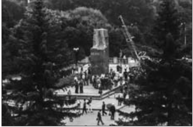
Демонтаж пам’ятника Леніну

Суттєві зміни, викликані новими реаліями суверенної Української держави, відбувалися після проголошення Незалежності України 24 серпня 1991 року. 25 серпня стало одним з особливих в історії Волині – початком нової доби, яка завершила комуністичний період, що тривав у нашому краї з 1939 р., та розпочала відлік часу у самостійній Українській державі, у боротьбі за яку віддали своє життя тисячі волинян. У цей день, що навіки закарбувався у пам’яті, Волинською обласною Радою було прийняте роз-