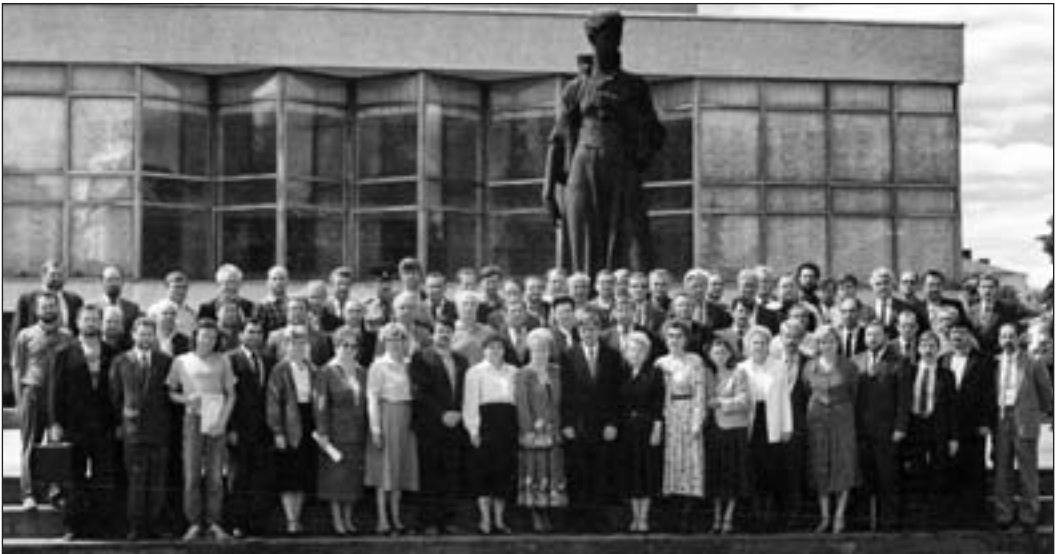
Депутати Луцької міськради

1994 рік став особливим, ураховуючи інтенсивність виборчих кампаній, що відбулися у цьому році, а також зміни, що відбулися у керівництві органів влади області. У березні пройшли парламентські вибори, а у червні – президентські та місцеві.