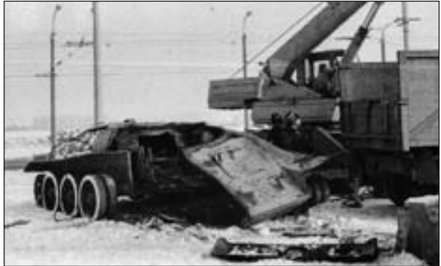
Демонтаж танка на проспекті Соборності у м. Луцьку

12 грудня 1992 р. Луцька міська Рада прийняла рішення «Про демонтаж пам'ятників, які втратили історичну цінність». Відповідно до цього рішення, до 1 квітня 1993 р. підлягали демонтажу пам'ятники: «На честь радянських льотчиків» (літак), «На честь радянських артилеристів» (гармата), «На честь радянських танкістів» (танк). Танк, який мав бути демонтований на проспекті Соборності,