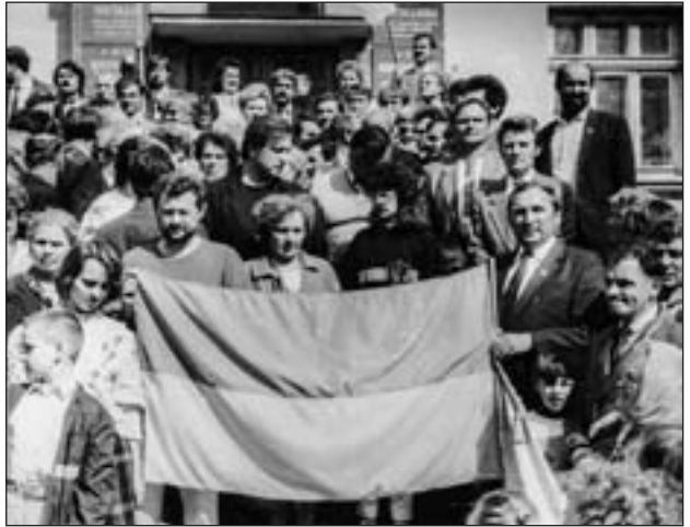
Депутати міської Ради з національним прапором