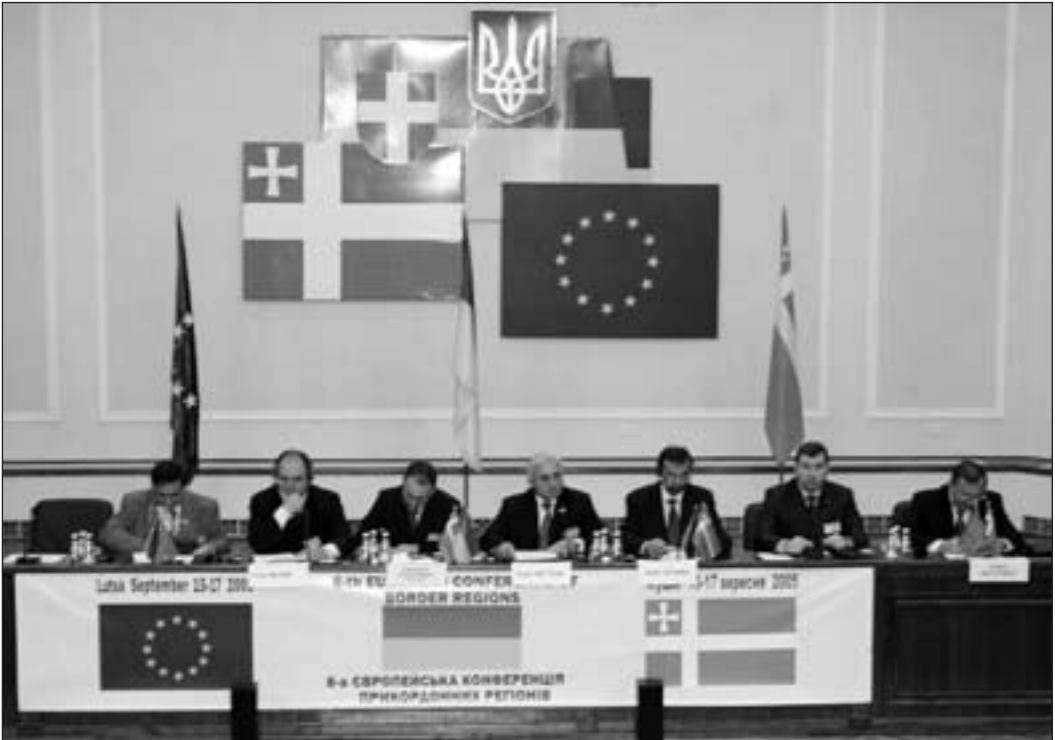
VIII Європейська конференція прикордонних регіонів