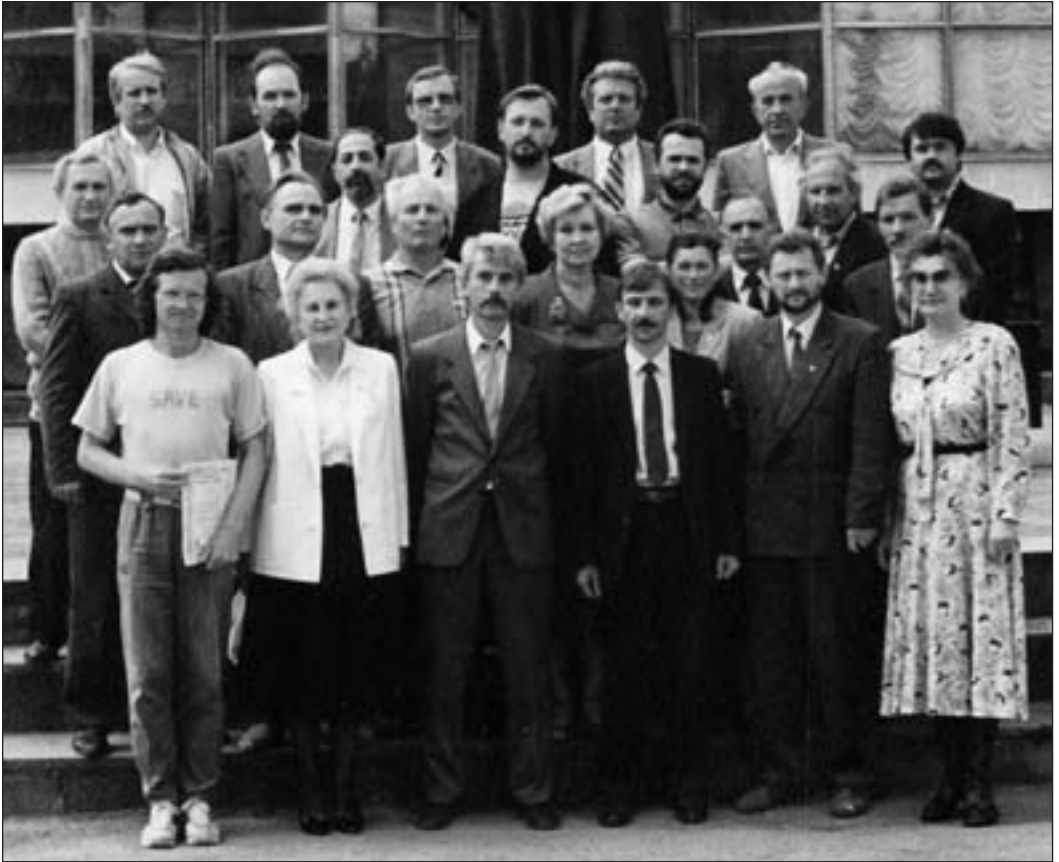
Депутатська група «Ініціатива» у Луцькій міській Раді