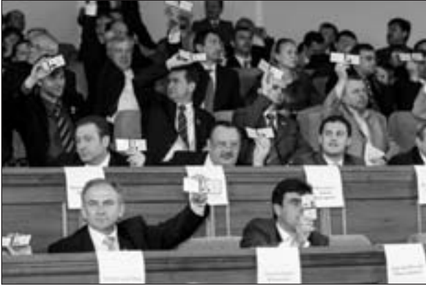
Депутати обласної ради голосують посвідченнями

у складі по одному представнику від усіх семи партій та блоків, що пройшли до обласної ради. БЮТівці також наполягли на прийнятній для себе процедурі голосування – не на сцені сесійної зали, де були розташовані кабінки заповнення бюлетенів, а у фойє, де можна було здійснити контроль щодо голосування однопартійців.