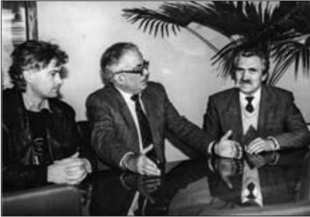
Кандидат у народні депутати України Л. Лук'яненко в редакції газети «Волинь»

А по Нововолинському виборчому округу № 68 20 листопада народний депутат України все ж був обраний. Тут, на відміну від Луцького Центрального