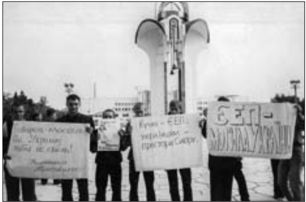
Мітинг проти ЄП на Київському майдані м. Луцька

Восени 2002 р. по Україні пройшла хвиля акцій «По-встань Україно!», організованих опозицією («Наша Україна», ВО «Батьківщина», СПУ). У Луцьку 16 вересня відбулося два мітинги: на Київській площі мітингували представники лівих партій, а на Театральному майдані – правих. Ніхто з представників влади до мітингувальників не вийшов, більше того, Луцька міська рада через суд намагалася заборонити ці акції, однак суд відмовив їй у цьому.