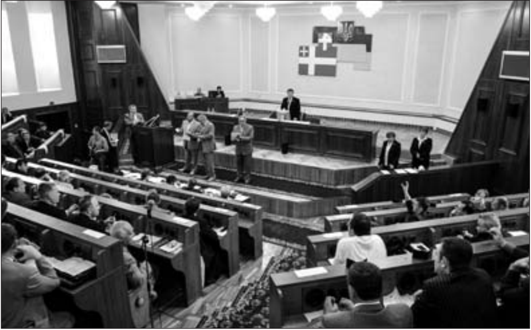
Робочий момент другої організаційної сесії обласної ради