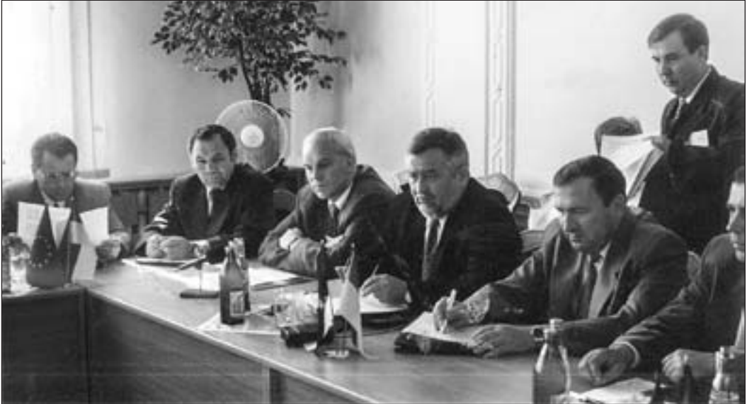
Підписання угоди про створення транскордонного об'єднання Єврорегіон «Буг»

це був удар по місцевому самоврядуванню. У зв'язку з цим він підтримав ідею утворення двопалатного парламенту, у верхній палаті якого всі області були б представлені однаковою кількістю сенаторів. 69