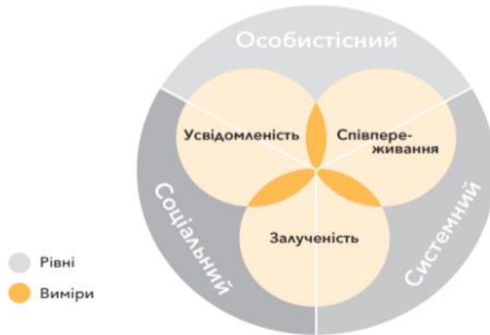
Рис.1. Рівні та виміри СЕЕН

Отже, можемо відзначити, що формування соціально-емоційних навичок є актуальним та пріоритетним напрямком роботи сучасної школи з учнівською молоддю. Однак специфіка соціально-емоційного навчання та розвитку емоційної сфери серед учнів досліджені ще не на достатньому рівні. Це відкриває нові горизонти для подальшого вивчення зазначеної проблеми.